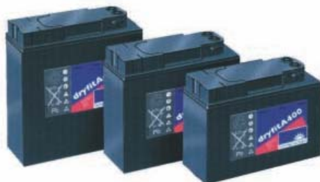
akumulatory serii A400 w wersji 19-calowej

Szafa w wykonaniu standardowym przystosowana jest do umieszczania w niej 2x4 szt. akumulatorów typu A400 w wersji 19" firmy Sonnenschein na dwóch półkach o maksymalnej łącznej pojemności C10=96Ah. Typowym zastosowaniem szaf są aplikacje telekomunikacyjne, automatyki przemysłowej, oraz inne wymagające małej powierzchni dla zabudowy baterii akumulatorów.